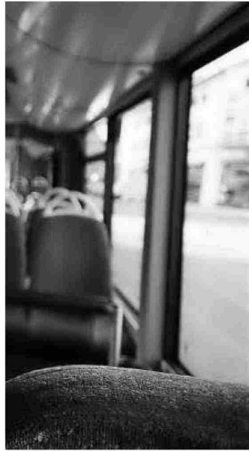
y no con dinero.