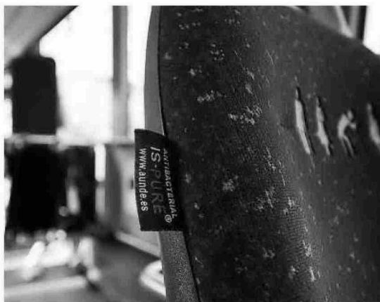
Asiento antibacterias de una villavesa, que también repele los virus.

En lo que se refiere a la plantilla, se recomienda adoptar las medidas de higiene propuestas por el Ministerio de Sanidad y se está coordinando la distribución de gel hidroalcohólico para todos los conductores. Por otra parte, para evitar la manipulación de monedas y billetes, se recomienda a las personas usuarias la utilización de las tarjetas de transporte como medio prioritario de pago.