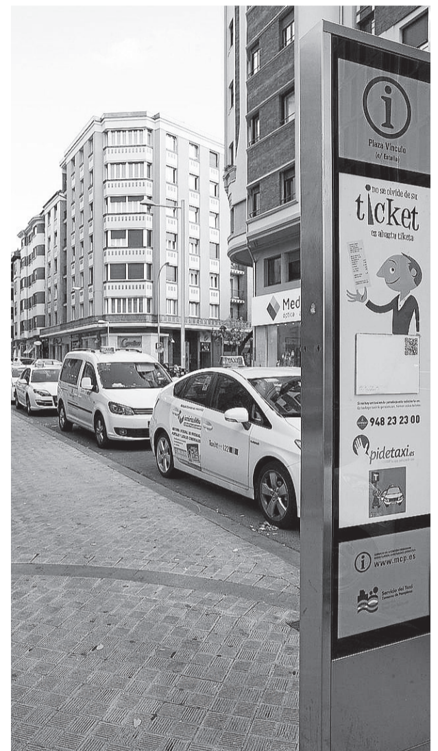
Taxis aparcados en la calle Estella de Pamplona.

TASA DE 25,20 EUROS Según se recoge en las bases de la convocatoria, las solicitudes podrán presentarse hasta el martes, 28 de febrero, inclusive, en el Registro General de la Mancomunidad de la Comarca de Pamplona, calle General Chinchilla, 8, de Pamplona, en horario de 8 a 14 horas. Entre la documentación requerida, hay que presentar el justificante de haber abonado a la MCP la tasa de 25,20 euros en concepto de participa-