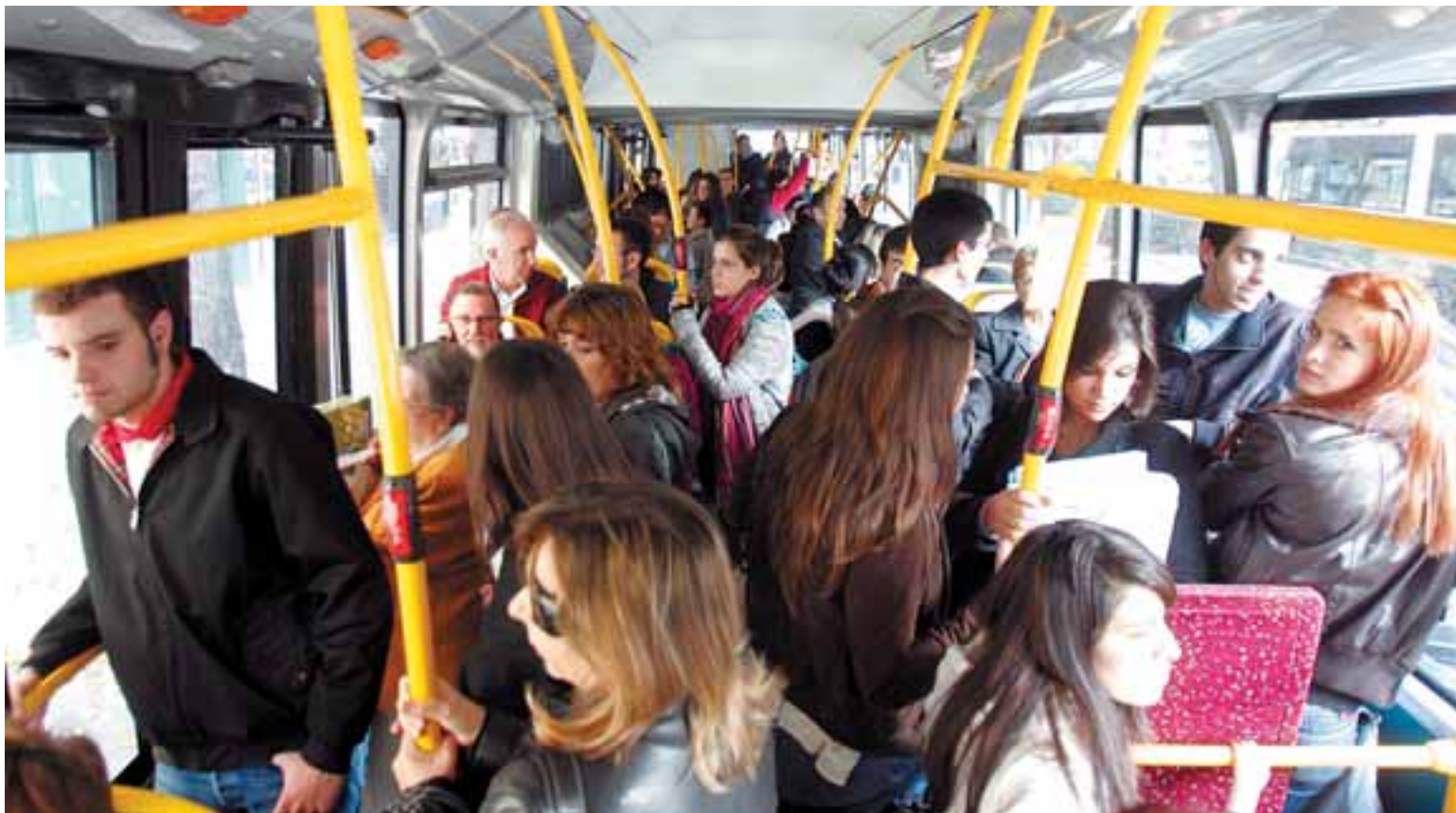
Las mujeres son mayoría en las villavesas.